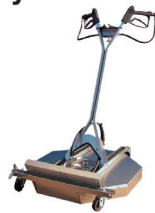
Nettoyeur de surface Surface Cleaners