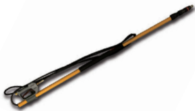
Lance télescopique Telescopic wands

Produits qui pourraient vous intéresser Products that may interest you