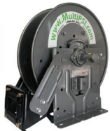
Dévidoirs Hose reels