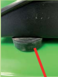
Couvert de protection aux extrémités pour éviter des blessures Protective cover at the ends to avoid injuries